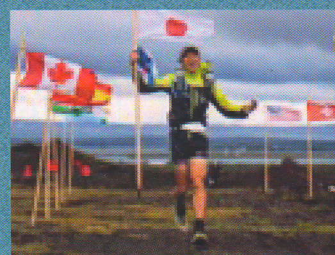
スペシャルゲスト・北田雄夫